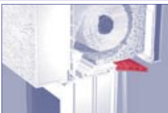
při zaomítnutí možnost revize zespodu