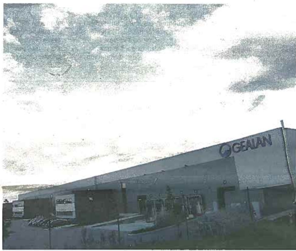
Gevrey-Chambertin. La plateforme logistique des Terres d'Or (18.000 mètres carrés) affiche désormais complet avec l'implantation de Gealan et de Doras Matériaux.

Blasons de Bourgogne à Beaune, Orium à Mâcon, Gealan et Doras Matériaux à Gevrey-Chambertin : les implantations signées ces dernières semaines dans les grandes plateformes logistiques de Bourgogne pourraient laisser penser que les investisseurs ont mangé leur pain noir. Pas si évident. Plus de 100.000 mètres carrés restent vides dans les cinq immenses plateformes construites en blanc, dans les années 2000, le long de l'axe autoroutier nord-sud. À Chalon-sur-Saône par exemple, 68.000 mètres carrés cherchent toujours preneur au Distripôle. Et l'unique bâtiment du Magnapark de Pagny est vide depuis le départ de But. Pour autant, la position géographique de la Bourgogne, la multimodalité de certains sites, la qualité des équipements et la baisse du montant des loyers incitent les chargeurs à s'intéresser de près à cette nouvelle génération de bâtiments logistiques. Page 3