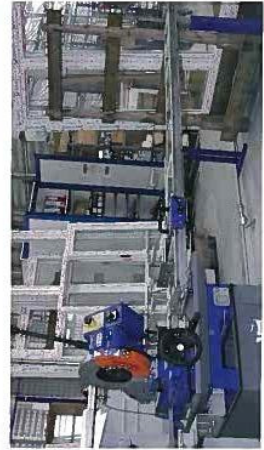
BANK D'ESSAIS. LE BANC D'ESSAI AIR EAU VENT PERMET DE PLACER LES FENETRES DANS DES CONDITIONS ATMOSPHERIQUES REELLES. CELES PROCHES DE CELLES D'UN OURAGAN. UNE FOIS CE TEST REUSSEI, ELLES SONT OFFICIELLEMENT RECOGNUES POUR LE MARCHÉ FRANÇAIS PUISQUE ELLES REPENDENT AUX NORMES NF.