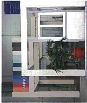
SHOWROOM. LES CLIENTS QUI SE DÉPLACENT CHEZ GEALAN PEUVENT Y DÉCOUVRIR UN SHOWROOM EXPOSANT QUELQUES-UNS DES PRINCIPAUX PRODUITS DU GAMMISTE. C'EST ÉGALEMENT ICI QUE DES FORMATIONS PRODUITS LEUR SONT PROPOSÉES. CET DÉPLACEMENT PERMET D'AUTRE PART À L'ENTREPRISE DE FORMER SES PROPRES COMMERCIAUX.