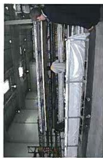
COMMANDES. (C-DESSUS ET A DROITE) L'UNE DES FORCES DE GEALAN RESIDE DANS SA CAPACITE A LIVRER SES CLIENTS DANS UN DELAI MAXIMUM D'UNE SEMAINE. MAIS SON AUTRE ATOUT MAJEUR ET NON DES MOINDRES EST LE CONFORT DES CLIENTS. LES REPRESENTANTS CHARGENT PARFOIS DES LOTS REPRESENTANT DES DEMANDES POUVANT COMPRENDRE QUELQUES UNITES DE GAMME. UNE FOIS LES CASIERS REMPLIS, ILS SONT CLASSES A L'AIDE DE CHARIOTS ELEVEURS EN ATTENDANT L'ARRIVEE DES CAMIONS DE LIVRAISON.