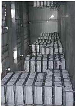
STOCK. LA PLATE-FORME FRANÇAISE COMPTE EN MOYENNE UN MILLION DE PROFILS EN STOCK ET ATTEND DE LIVRAISON DANS TOUT L'HEXAGONE.

Nouveauté : cependant, Gealan utilise un procédé de collage par adhésif du vitrage sur le PVC. Ce sont alors les vitres elles-mêmes qui assurent la rigidité des ensembles de menuiserie. D'après les résultats des tests, la solidité obtenue ainsi est supérieure à celle des renforts d'acier. Mais l'avantage fondamental de cette nouveauté, c'est surtout la possibilité de fabriquer de gros éléments mobiles de fenêtres sans que la quincaillerie, aussi solide soit-elle, en souffre.