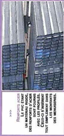
>>> RENFORCEMENT AVEC UN MATERIAU RIGIDE, DES RENFORTS D'ACIER SONT FOURNIS AVEC LES PROFILS. CEUX-CI S'INSERENT TOUT SIMPLEMENT DANS LES MONTANTS DES MENUISERIES.

Gealan a su séduire les Français en leur apportant un produit de couleur et innovant. « La couleur a été un véritable atout pour nous différencier sur le marché en France. Il n'y avait pas de réelle demande mais les gens ont adopté nos différents coloris tout simplement parce que nous leur en avons proposé dans les showrooms de nos clients. Nous vivons dans une société de consommation ». Le regard de cette SARL aux allures de start-up avec son personnel de cadres dirigeants ultra-qualifié dès le départ, comme aime à le décrire son dirigeant, se tourne maintenant vers le sud, plus exactement l'Espagne et le Maghreb. Toutefois, sa croissance la place face à un sérieux problème de recrutement. Les candidats n'étant de manière générale pas légion. Et avec les quelque 250 millions de fenêtres à remplacer en France, la filière n'en est sans doute qu'aux prémices de sa croissance.