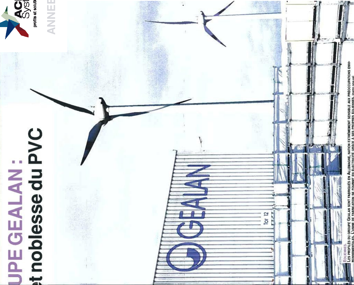
LES PROFILÉS DU GROUPE GEALAN SONT FABRIQUÉS EN ALLEMAGNE, NOTION EXTRÊMEMENT SENSIBLE AUX PRÉOCCUPATIONS ENVIRONNEMENTALES. L'USINE DE FABRICATION SE FOURNIT EN ÉLECTRICITÉ GRÂCE À SES PROPRES ÉOLIENNES.