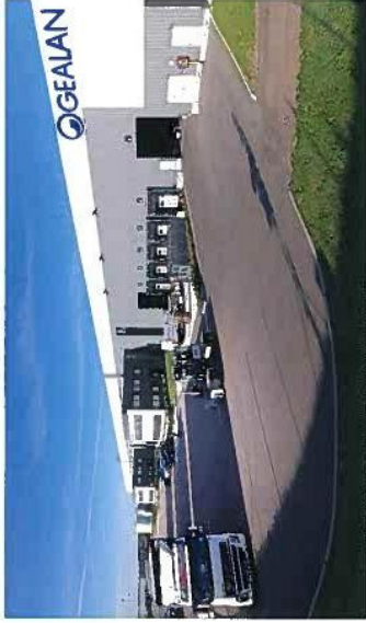
GEALAN FRANCE. LA FILIALE FRANÇAISE SITUÉE À GEVREY-CHAMBERTIN EST CELLE QUI CONNAÎT AUJOURD'HUI LA PLUS FORTE PROGRESSION EN EUROPE MALGRÉ UNE RÉPUTATION DU PVC ENTAQUÉ DANS L'UN DES PAYS LES PLUS DÉVELOPPÉS DE NOTRE PAYS. LES NOMBREUSES QUALITÉS DE CE MATÉRIAU SÉDUISENT DORENAVANT DE PLUS EN PLUS.