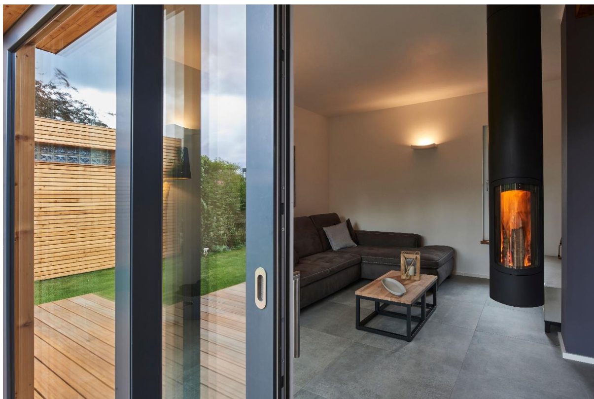
Die Hebe-Schiebe-Tür im GEALAN-System S 9000 in acrylcolor

Bildunterschriften (wenn nicht anders angegeben, Fotoquelle: GEALAN)