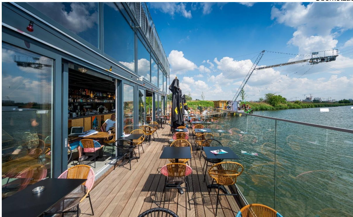
Glasfassade des Wakeboardzentrums Galgenweel in Antwerpen, im GEALAN-System S 9000 NL in acrylcolor RAL 7016 (Anthrazitgrau)