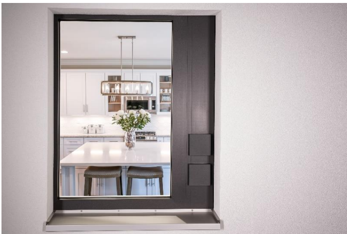
GEALAN-CAIRE® smart überputzt eingebaut

Entstanden ist die Produktfamilie GEALAN-CAIRE® : Von der Basislüftung bis hin zur Smart-Home-fähigen Komfortlüftung bietet sie die passende Lüftungslösung fürs Fenster. Architekten, Planer und Lüftungsexperten gestalten auf Basis der Lüftungsbedarfsrechnung und anhand der individuellen Ansprüche an die Lüftungsleistung (über Feuchteschutz hinausgehend: reduzierte Lüftung, Nennlüftung, Intensivlüftung) die passende Lüftungsauslegung.