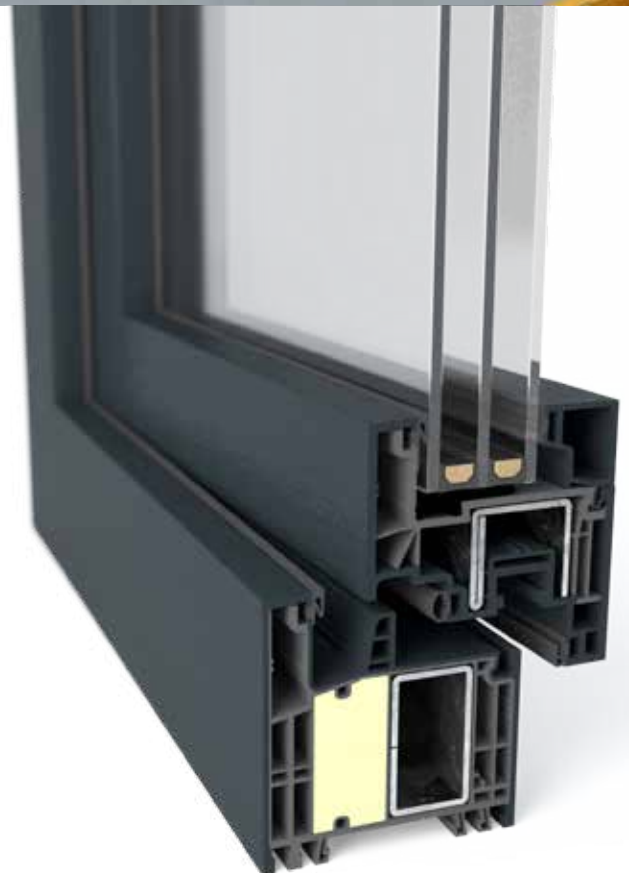
GEALAN-KONTUR® kozijn met 2 grote IKD® kamers

Als GEALAN-KONTUR® nat verlijmd is en er geen staal wordt gebruikt, kan de IKD®-schuimtechnologie ook in de vleugel worden gebruikt. Het gevolg: met schuimisolatie en zonder staal wordt de warmte-isolatie van het raam extra verhoogd.