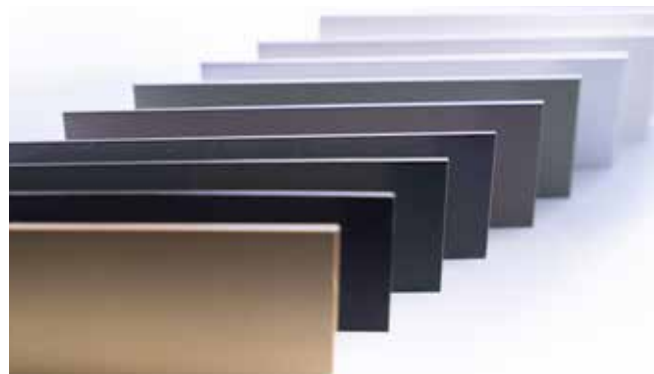
GEALAN-acrylcolor® is verkrijgbaar in alle beschikbare RAL-kleuren

Onze PMMA-oppervlaktetechnologie GEALAN-acrylcolor® verfijnt kunststof ramen met unieke eigenschappen. Uw zichtbare en merkbare voordelen: kleurvast, duurzaam, vuilafstotend. Het zijdematte buitenoppervlak blijft tientallen jaren weerbestendig en tijdloos elegant. In de toekomst zal GEALAN-acrylcolor® in talrijke standaard- en speciale kleuren in het GEALAN-KONTUR®-profiel-systeem verkrijgbaar zijn.