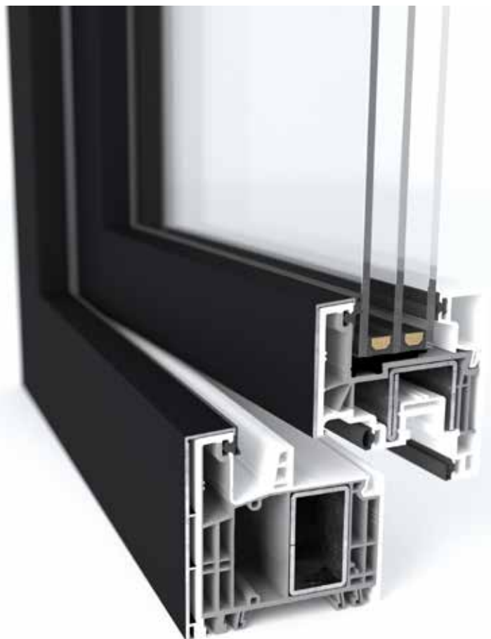
GEALAN-KONTUR® met aluminium kappen